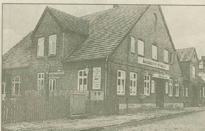
Das erste Vereinslokal war das frühere „Holsteinsche Haus“ an der Rolandstraße.